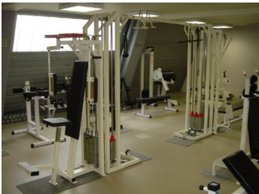
Salle de musculation

L'inscription dans la structure pourra se faire en externat, demi-pension ou internat (lycée des Iris à 100m du dojo) au tarif éducation nationale.